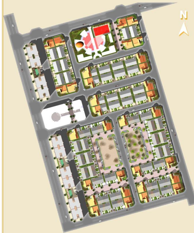
PLAN MASSE DU PROJET